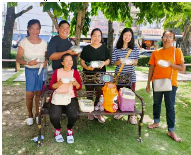
Regelmatig krijgen vrouwen uit het park een pakket levensmiddelen.