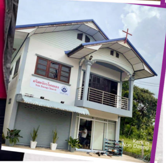
Kerk in Non Daeng