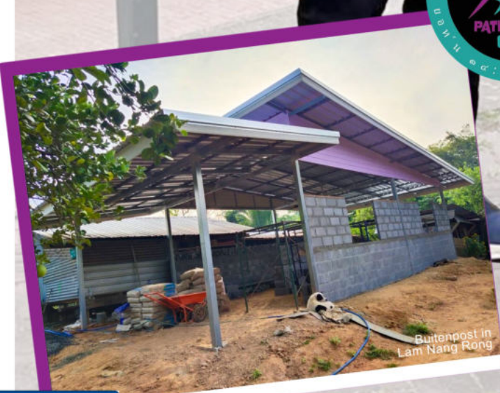
Buitenpost in Lam Nang Rong