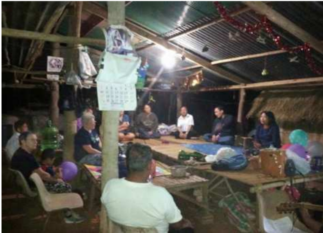
Bijeenkomst in Lam Nang Rong.