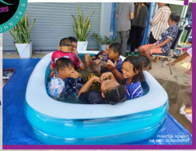
Heerlijk spelen na een doopdienst