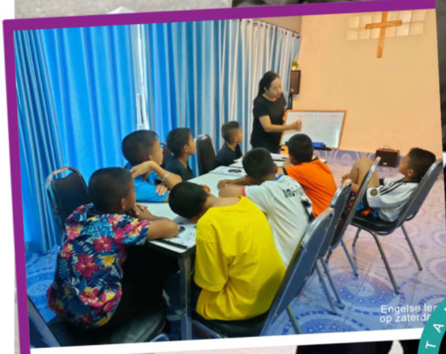
Engelse les op zaterdag