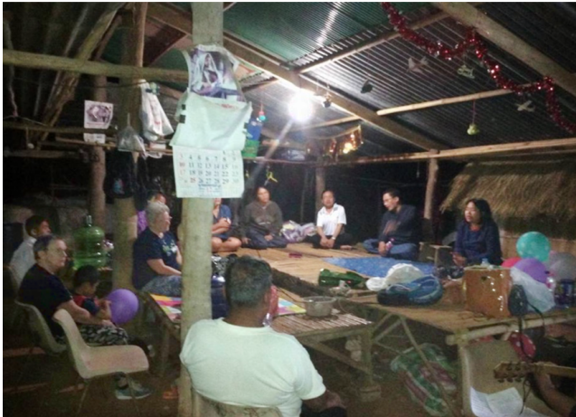
Bijeenkomst van een huisgroeigroep

Naast het bieden van allerlei activiteiten in de dorpen, plaatste God ook de stad Korat in ons hart, in het bijzonder de scholen. Op de scholen in de steden lopen kinderen en tieners risico. Door Gods genade kwamen we met de juiste mensen van de afdeling Onderwijs in contact. Dit gaf ons de mogelijkheid om via de organisatie van Engelse kampen toegang tot de scholen te krijgen. Elke maand houden we Engelse kampen op verschillende scholen. Behalve les in de Engelse taal leren we de kinderen over hun identiteit en eigenwaarde en vertellen we hen over Jezus. Als gevolg hiervan komen sommige kinderen met ons naar de kerk en nemen een aantal kinderen op zaterdag deel aan onze gratis Engelse lessen.